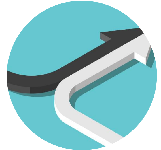
Strategie und Überwachung